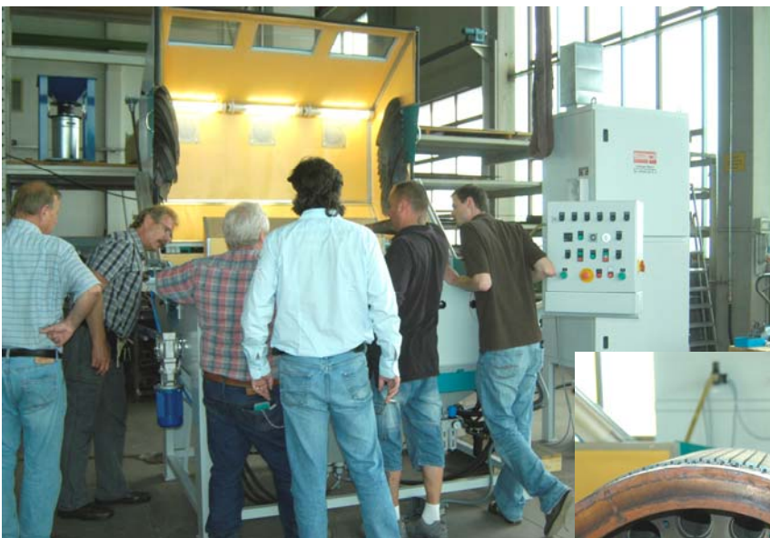
Strahlkabine nach Kundenanforderung